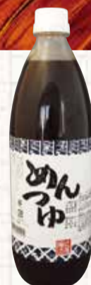
558 めんつゆ 1ℓ