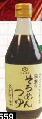
559 日東の そづめんつゆ 400ml