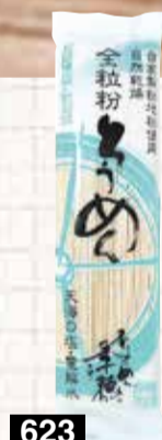
623 全粒粉 そづめん 240g

全国乾麺協同組合連合会が昭和57年から7月7日の七夕の日を「そづめんの日」と定めましたが、七夕にそづめんが食べられるようになった由来はとて古く、なんと古代中国の話にまでさかのぼるそうです。七夕だけでなく、節供に旬のものを食べ、邪気を祓ったり無病息災を願う風習はたくさんありますが、夏の暑さで食欲が減退するこの時期にそづめんはぴったり！天の川や織姫の織り糸にそづめんを見立て盛り付けをしたり、いろいろな形でお楽しみください。