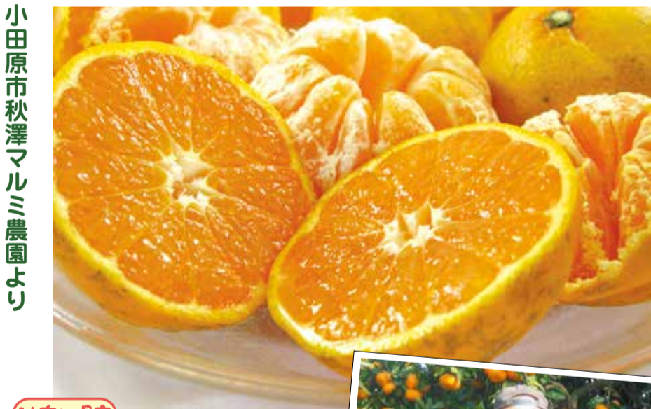
小田原市秋澤マルミ農園より

神奈川県 無農薬 低化学肥料 秋澤マルミ農園(神奈川県小田原市) 秋澤さんの青島みかん 530050 直送【送料込み】 5kg 3400 円(税込3672円) 530062 直送【送料込み】 10kg 5000 円(税込5400円)