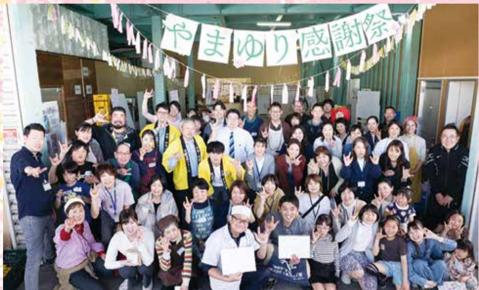
出店者と感謝祭実行委員